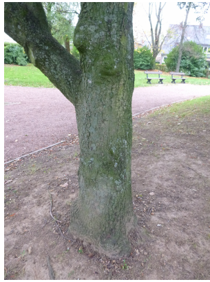
, 16 Novembre 2015