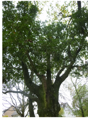
, 16 Novembre 2015