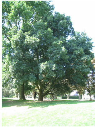
, 30 Juillet 2008